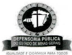
Camila Machado Umpierre